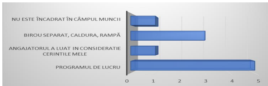
Figura nr. 3 Adaptările locului de muncă la dizabilitate

Potrivit graficului de mai sus, 9 persoane chestionate, un beneficiar fiind în căutarea unui loc de muncă (șomer), au relatat următoarele: ”program flexibil de lucru”; ”birou/cabinet la primul etaj”; ”mi s-a acordat/ofert birou aparte”; ”birou separat, căldură, rampă”.