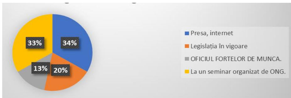
Figura nr. 1 Nivelul de cunoaștere a cadrului legislativ în domeniul angajării persoanelor cu dizabilități.

În ciuda resurselor legislative puse la dispoziție, procesul de integrare pe piața muncii a persoanelor cu dizabilități este îngreunat și de faptul că legea din Republica Moldova nu prevede sancțiuni pentru angajatorii care nu au angajat persoane cu dizabilități, majoritatea mulțumindu-se cu inserarea postului disponibil în organigramă